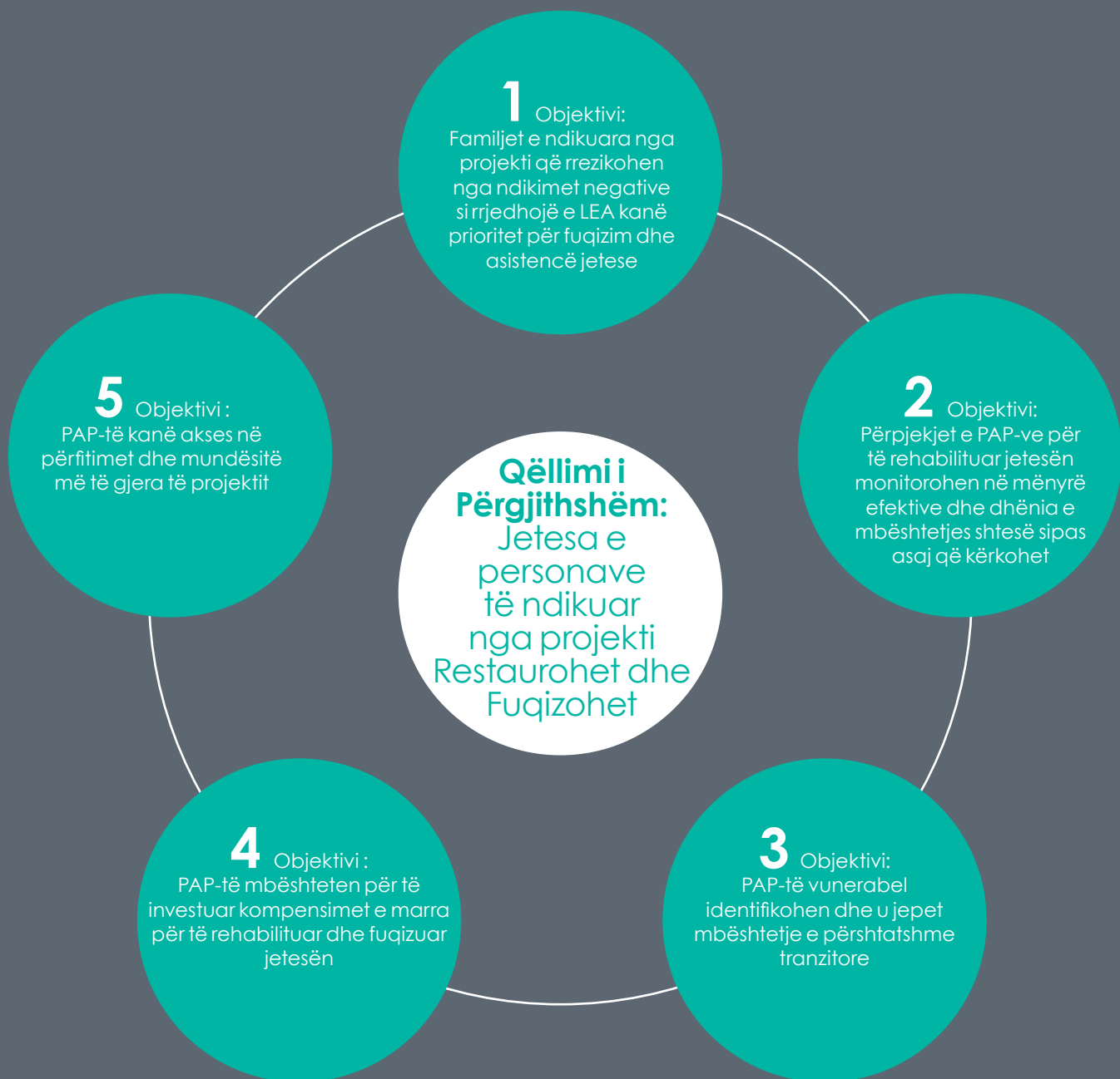
Figura 2. Qëllimet dhe objektivat e AJMT